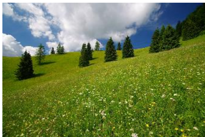
Tieto lúky sa na akcii kosia